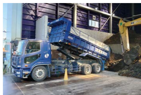
■ 建設発生土のストック

現場からの発生土は都内数か所に保有している屋内型ストックヤードなどに運搬します。現場近くのストックヤードに運搬することで現場作業の効率化を図っています。請負や常用、骨材の配達、ダンプ、重機、土工の手配も可能で、建設発生土の運搬処理をワンストップで効率的に行うことができます。各事業所、営業所の営業時間などは、本案内の裏面をご覧ください。